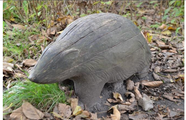
Redskab: Klatredyr Årgang: 2015 Producent: Lekolar/Leika Er redskabet mærket: Ja Er der registreret fejl/mangler: Nej