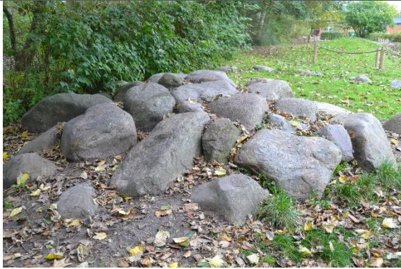
Redskab: Klatresten Årgang: Producent: Er redskabet mærket: Nej Er der registreret fejl/mangler: Nej