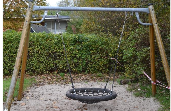
Redskab: Fugleredegynge Årgang: Producent: Er redskabet mærket: Nej Er der registreret fejl/mangler: Ja