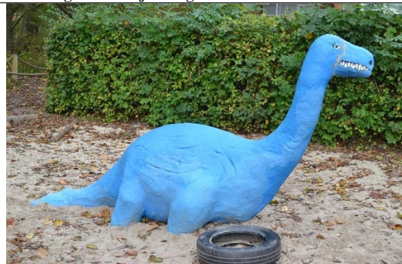
Redskab: Klatredyr Årgang: Producent: Er redskabet mærket: Nej Er der registreret fejl/mangler: Nej