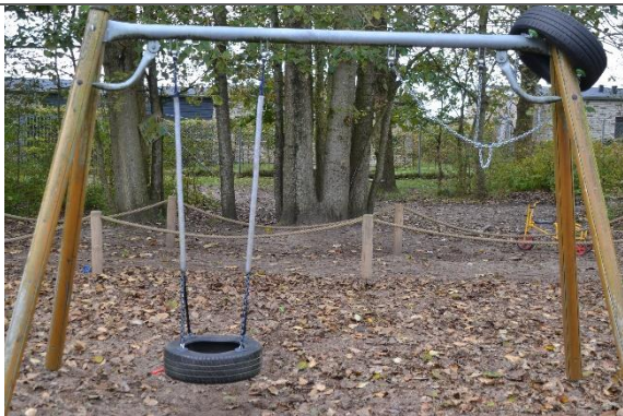
Redskab: Gyngestativ Årgang: Producent: Er redskabet mærket: Nej Er der registreret fejl/mangler: Nej