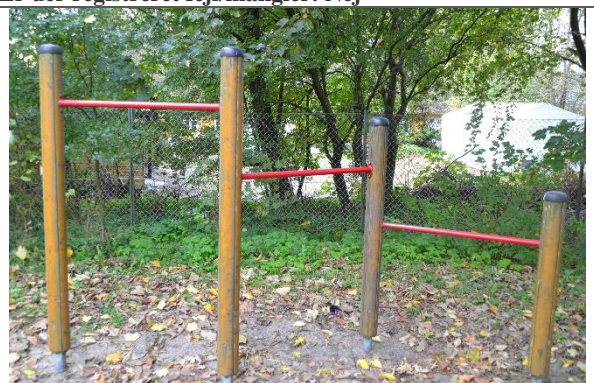
Redskab: Kolbøttestænger Årgang: Producent: Hags Er redskabet mærket: Ja Er der registreret fejl/mangler: Ja