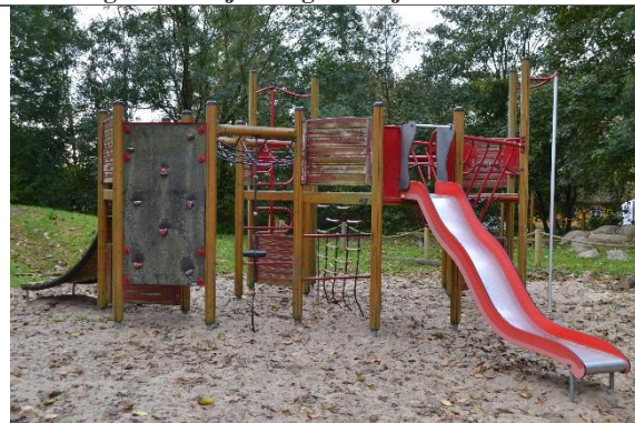
Redskab: Klatrestativ med rutsjebane Årgang: 2008 Producent: Hags Er redskabet mærket: Ja Er der registreret fejl/mangler: Ja