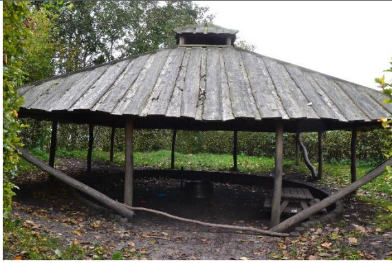
Redskab: Madpakkehus Ikke omfattet af DS/EN 1176