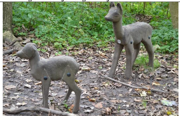
Redskab: Klatredyr Årgang: 2016 Producent: Lekolar/Leika Er redskabet mærket: Ja Er der registreret fejl/mangler: Nej