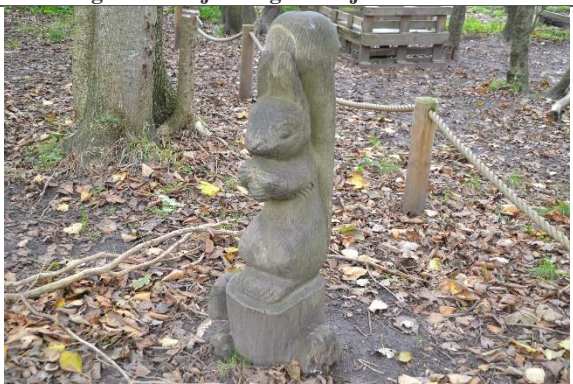
Redskab: Klatredyr Årgang: 2015 Producent: Lekolar/Leika Er redskabet mærket: Ja Er der registreret fejl/mangler: Ja