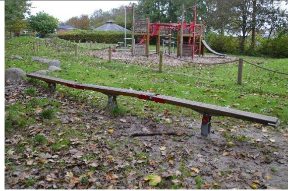
Redskab: Balancebom Årgang: Producent: Hags Er redskabet mærket: Ja Er der registreret fejl/mangler: Nej