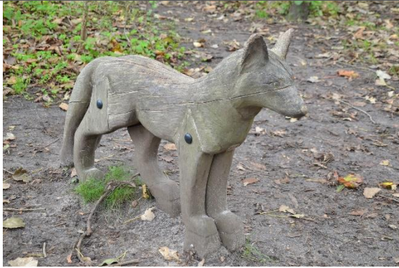
Redskab: Klatredyr Årgang: 2015 Producent: Lekolar/Leika Er redskabet mærket: Ja Er der registreret fejl/mangler: Nej