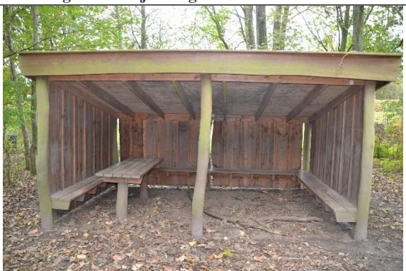
Redskab: Madpakkeskur Ikke omfattet af DS/EN 1176