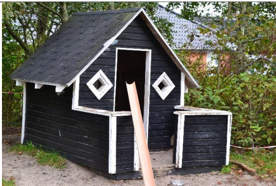
Redskab: Legehus Årgang: Producent: Esbjerg Produktionsskole Er redskabet mærket: Nej Er der registreret fejl/mangler: Nej