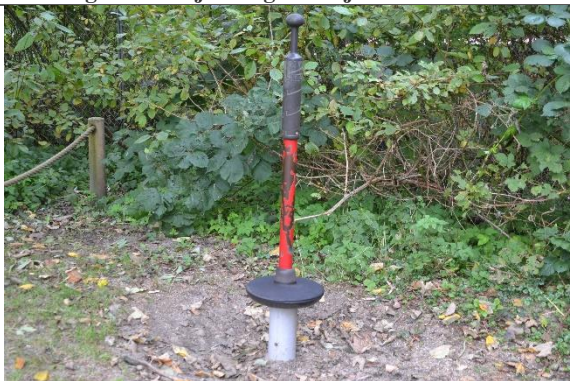
Redskab: Spinner Årgang: Producent: Hags Er redskabet mærket: Ja Er der registreret fejl/mangler: Nej