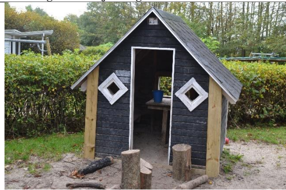
Redskab: Legehus Årgang: Producent: Esbjerg Produktionsskole Er redskabet mærket: Ja Er der registreret fejl/mangler: Nej